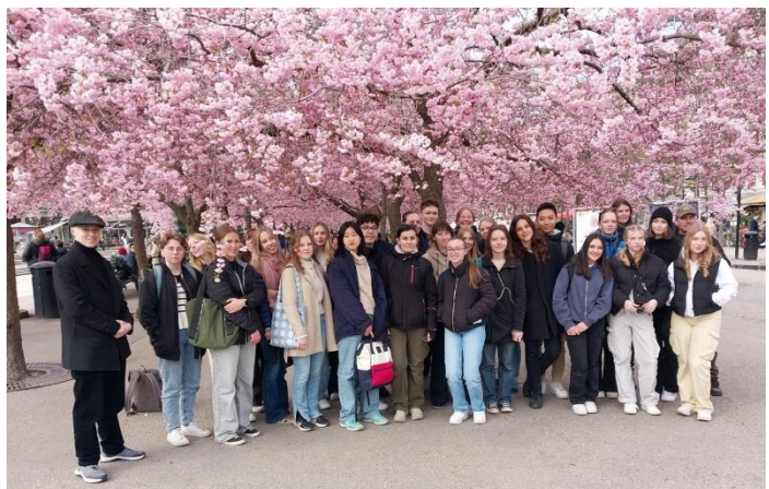
Projekttreffen April 2023: Stockholm